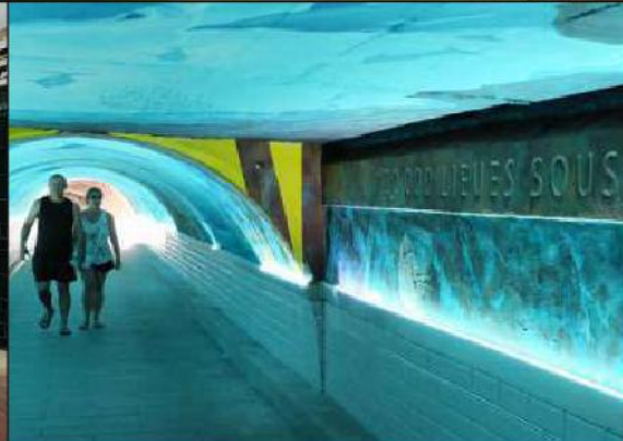
L'avenue Pierre-Sémard et le tunnel reprennent des couleurs. Et les habitants retrouvent le sourire.